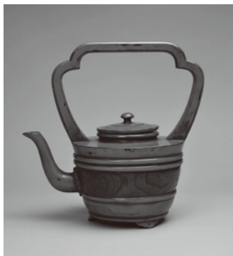
根来手付湯注 室町時代 15世紀