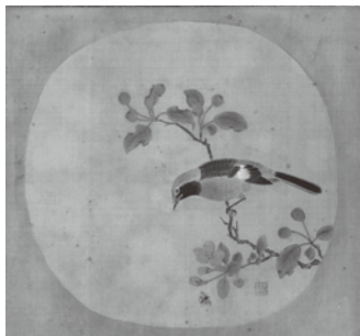
伊川院晴川院唐画写画帖より 江戸時代 18-19世紀