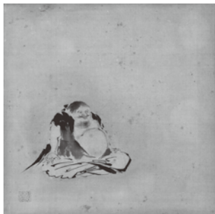
伊川院晴川院唐画写画帖より 江戸時代 18-19世紀

「2」館長によるギャラリートーク 八月五日(日)一四:〇〇〜 館長の高橋が、みなさまと展示室を一緒にめぐりながら、展覧会に 込められた想いや、個々の作品に込められた意味を丁寧に解説してゆく。