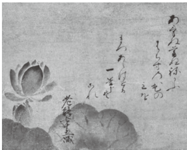
蓮図 能阿弥筆 室町時代 15世紀