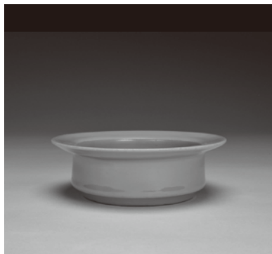
青磁 洗 南宋時代 12世紀