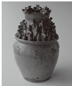
青磁神亭壺 東晋時代 3世紀